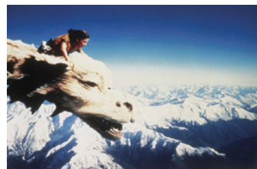
94分 | 1984 | 西ドイツ・アメリカ 監督: ウォルフガング・ペーターゼン

本好きの少年バスタアンは、古本屋で「はてしない物語」という立派な本を見つける。石を食べる怪物や巨大な亀、空飛ぶ竜ファルコンなど奇想天外ないきものたちがすむ不思議な世界「ファンタージェン」では、勇敢な少年アトレューが幼い女王を救うため、冒険の旅に出る! バスタアンとアトレューの世界がいつのまにか交わって…。