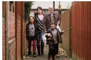
100分 | 2016 | イギリス 監督: ケン・ローチ