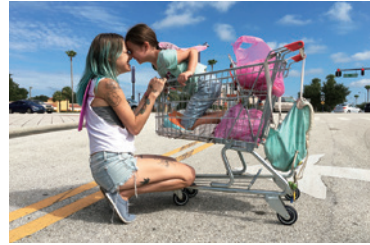
112分 | 2017 | アメリカ 監督: ショーン・ベイカー

胸がはりさけるほど切なく、ハッピーエンドさえしのご、 マジカルエンドが待っている。