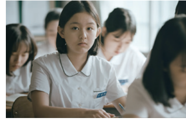
138分 | 2018 | PG12 韓国 | 監督: キム・ボラ

14歳の少女ウニ。この世界が、気になった。 …先生、わたしの人生もいつかかがやくのでしょうか。