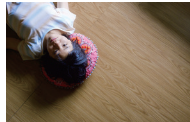
115分 | 2019 | PG12 日本・アメリカ合作 監督: HIKARI

私は私でよかった…。ひとりの女性の人生が 大きく羽ばたく、その瞬間に心が震える。