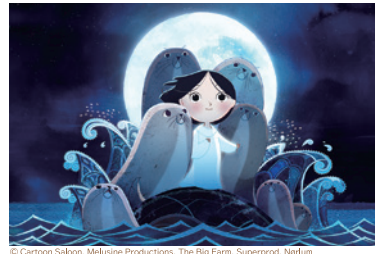
93分 | 2014 アイルランド・フランス・ベルギー・デンマーク 監督・原案: トム・ムーア

★上映後に、ぬりえワークショップを開催します! ..... ※詳細な内容は近日決定(劇場ウェブサイトでご確認ください)