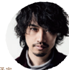
齋藤工さん ※予定 俳優・監督 / Mini Theater Park