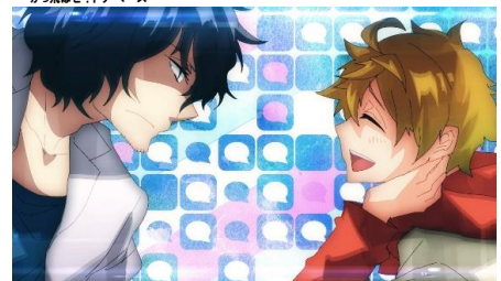
この男子、石化に悩んでいます。

※当日の上映分数は、ここに掲載したものと多少異なる場合があります。 ※上映開始30分後からの入場はおことわりします。