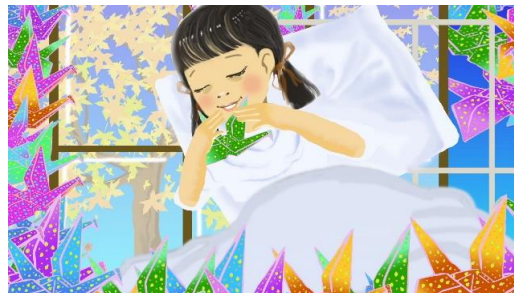
アマイとサダコの祈り