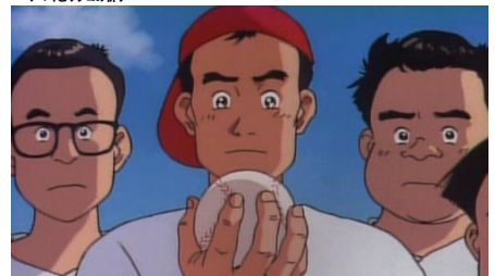
かっ飛ばせ! ドリーマーズ