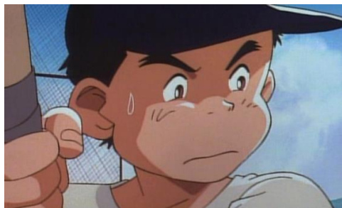
かっ飛ばせ！ドリーマーズ -カーブ誕生物語-