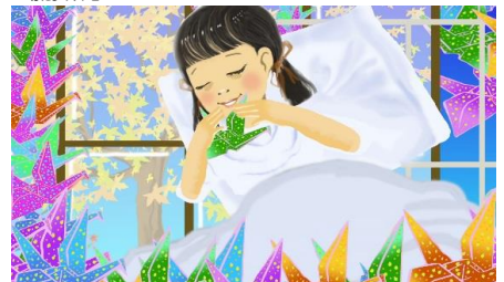
アマイとサダコの祈り

カープ誕生のエピソードを交えながら、原爆で家や家族を失った少年たちが草野球に打ち込んで、たくましく生きる姿を描く。