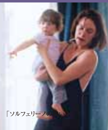
「ソルフェリーノの戦い」