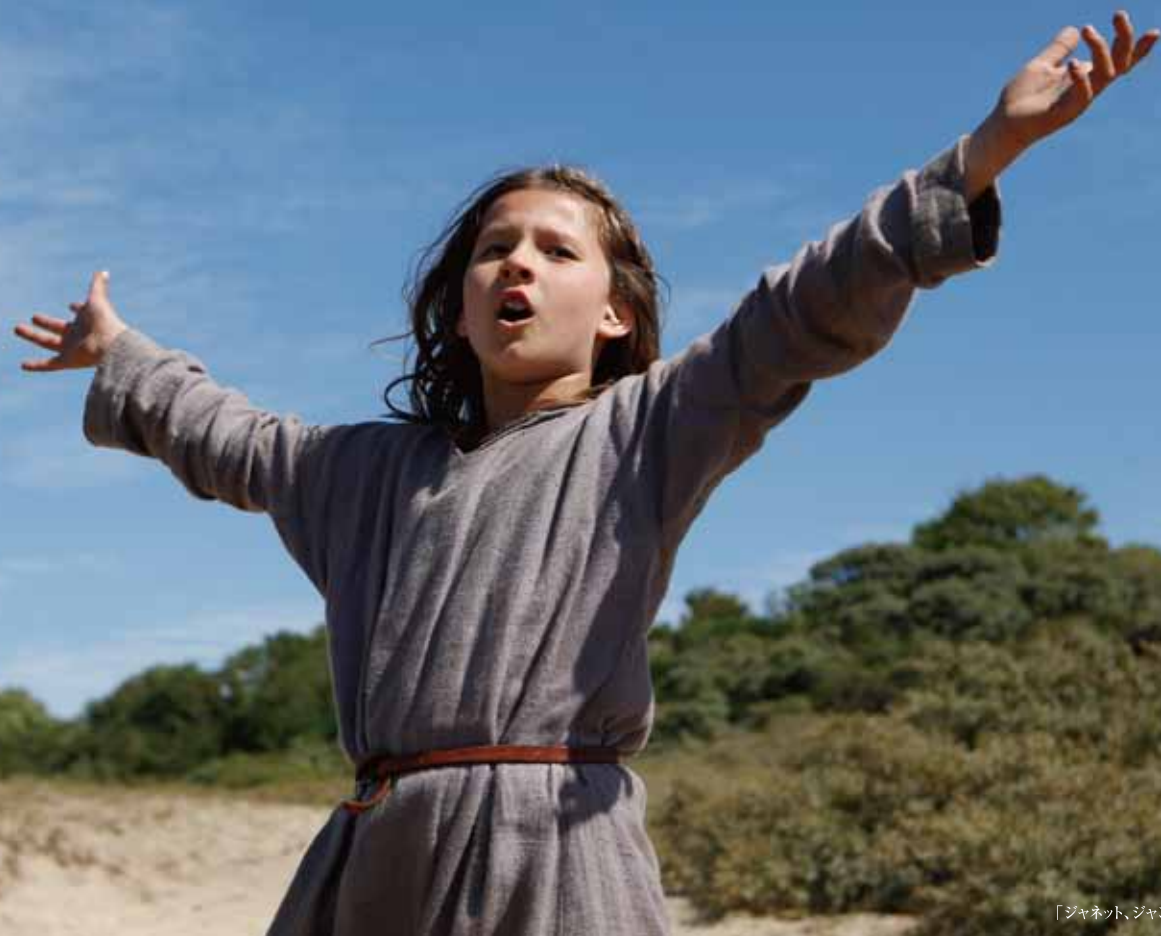
「ジャネット、ジャンヌ・ダルクの幼年期」