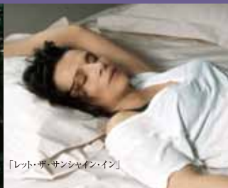
「レット・ザ・サンシャイン・イン」